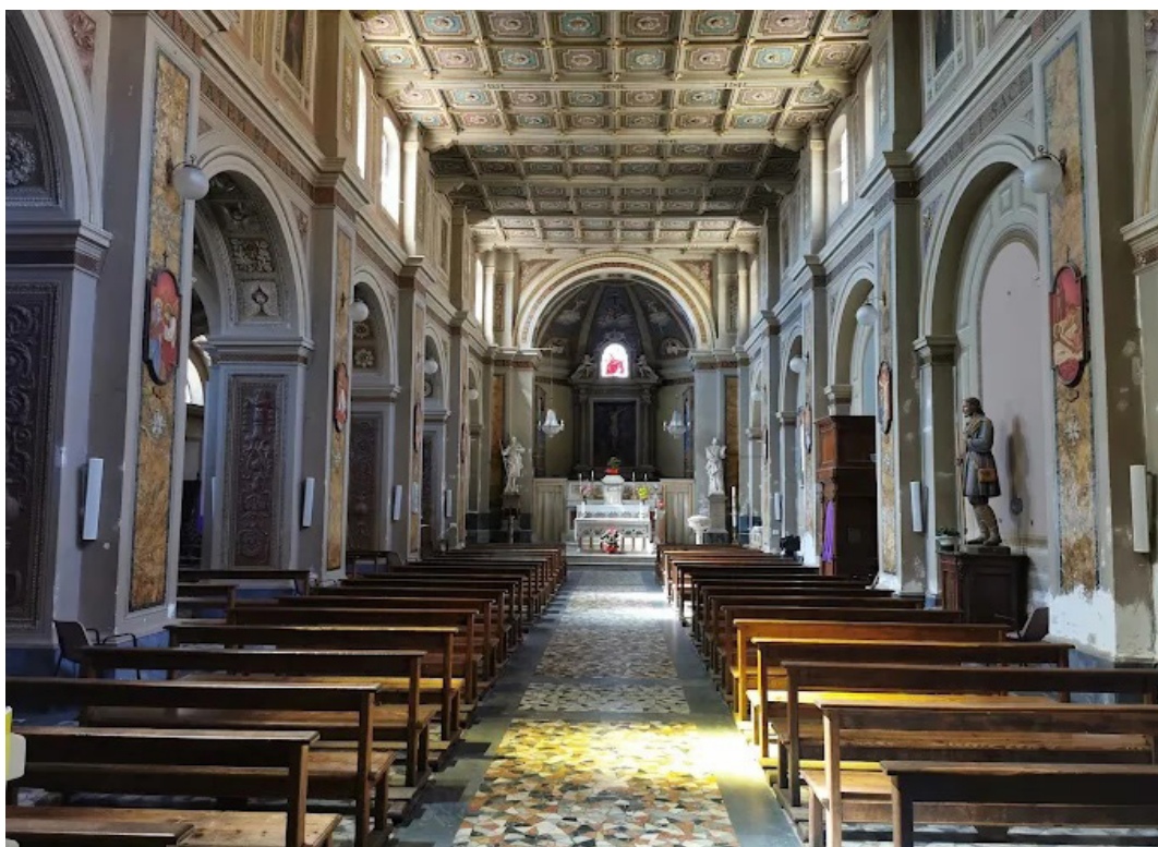
Farnese, chiesa di San Salvatore