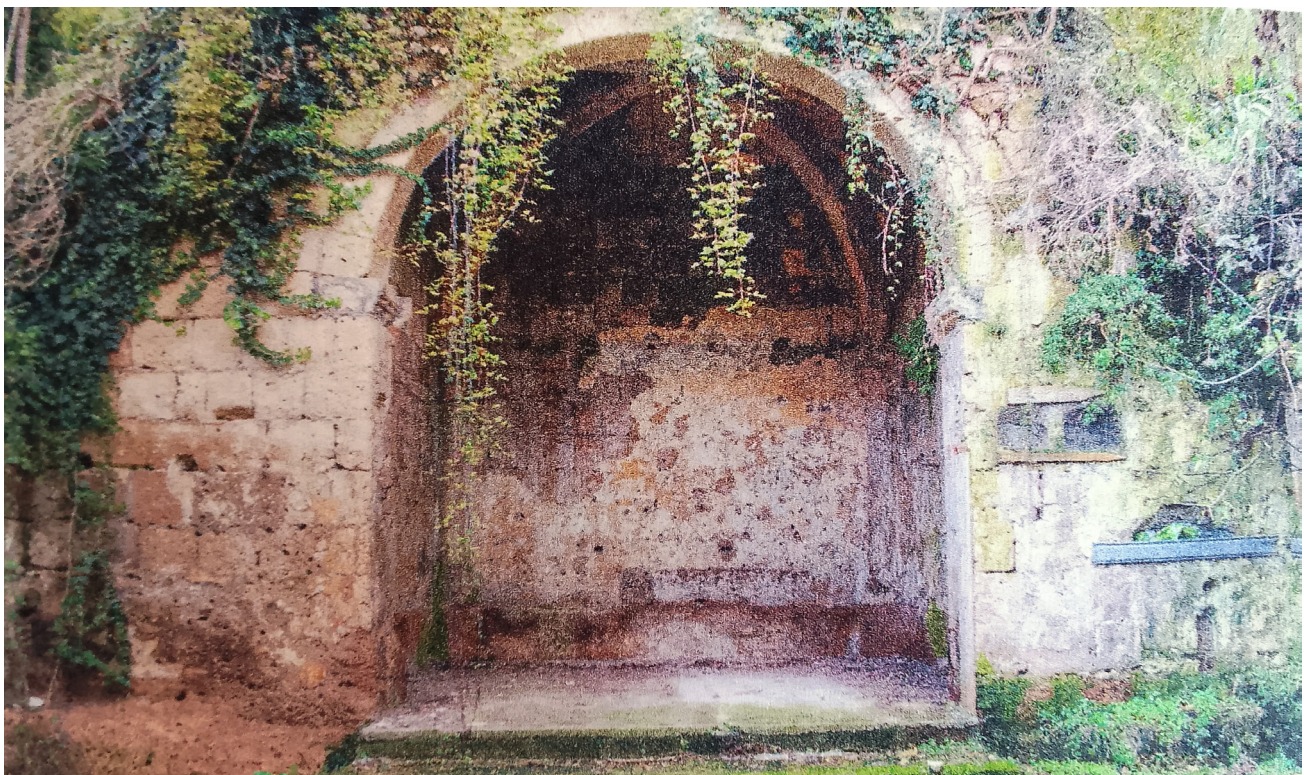
Canino, Chiesa di Santa Maria Maddalena