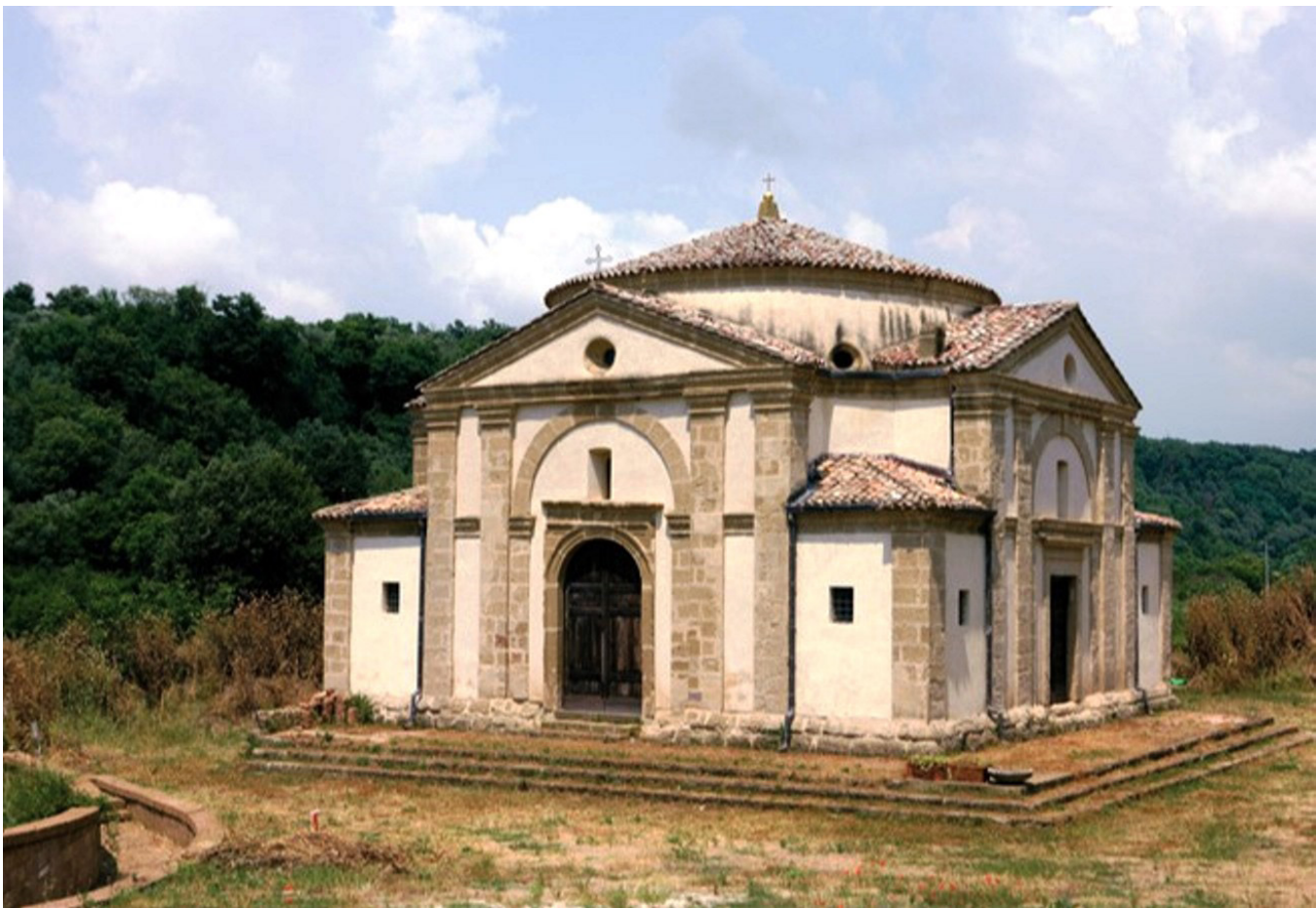
Cellere, chiesa di Sant'Egidio