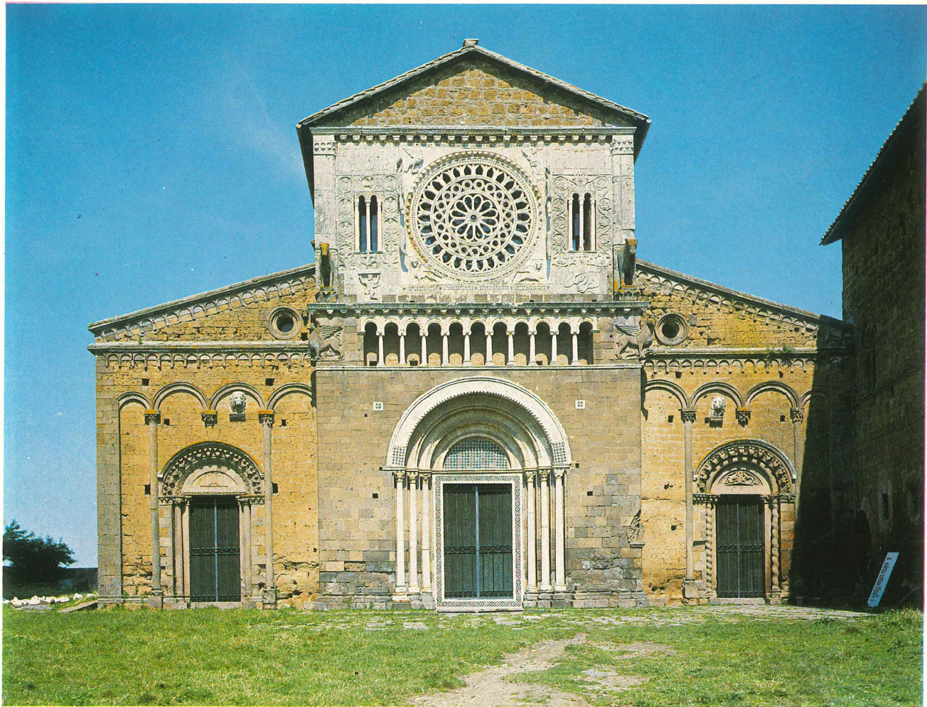
Tuscania, chiesa di San Pietro