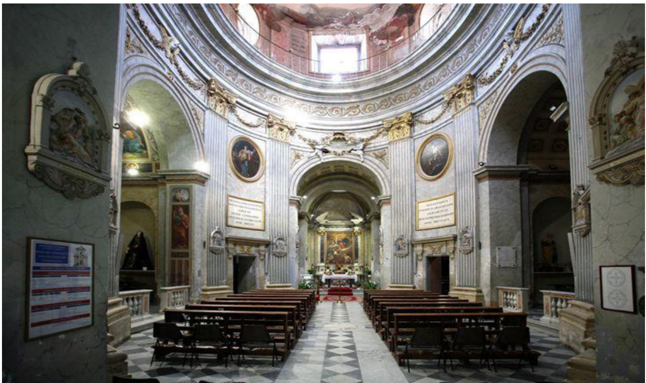
Civitavecchia, chiesa di Santa Maria