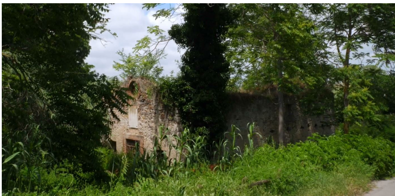
...Montalto, chiesa di Santa Lucia