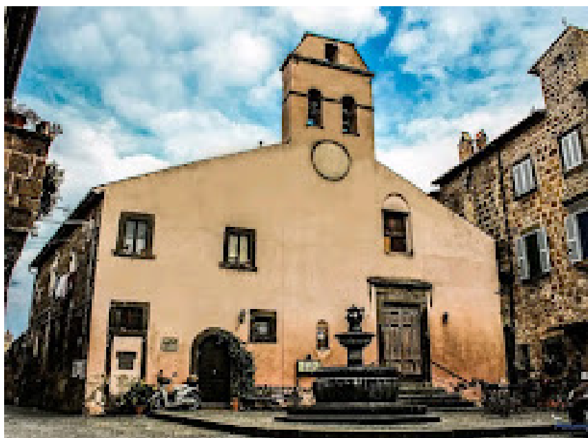
Barbarano, chiesa di Sant'Angelo