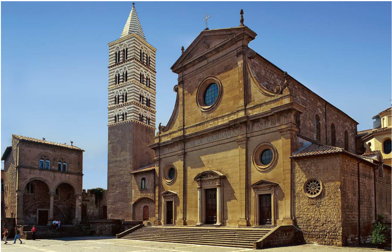
Viterbo, Cattedrale di San Lorenzo martire

La Visita delle chiese, oratori, luoghi pii è normalmente completata dall'emissione dei decreti relativi.