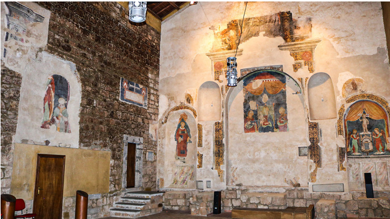
Blera, chiesa di San Nicola